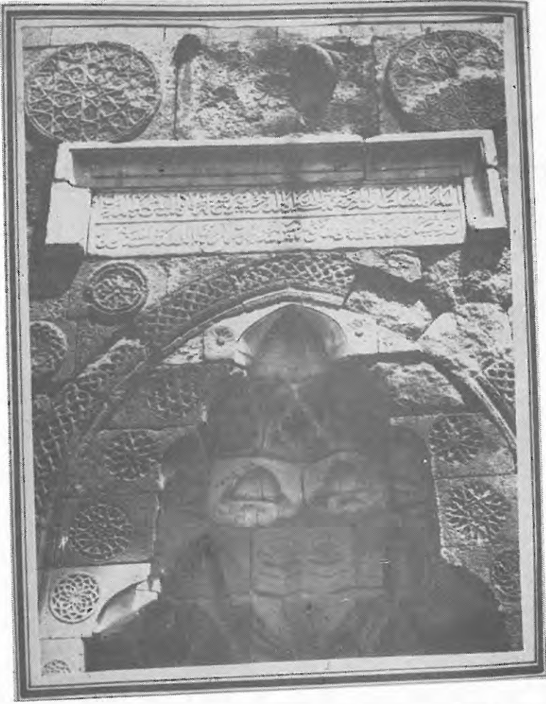
Şekil 2 : Şifaiye Medrese'sinin Kapısı; Kapı çeşitli piramitlerle, kapı kemei ve etrafı ise islam stilinde süslenmiştir. Kemerin üzerinde, dikdörtgen şeklindeki beyaz mermer üzerinde iki satırlık Arapça kitabe görülmektedir. Kitabenin üzerinde ve ortada iki karşılıklı yılan yer almaktadır. Bugün yalnız sağdaki kalmıştır. Yılanların ortasına, müdevvir (dönen) bir Selçuk Madalyonu yerleştirilmiştir.

ruldukları halde, Kayseri Tıbbiyesi laik bir teşekkül olarak kurulmuştur Sultan II. Mahmudun, 1839 da kurduğu, Tıbbiye-i-aliye-i-şahane, Kayseri Tıbbiyesinden tam 635 yıl sonra kurulmuştur. Bu bakımdan ilk Tıp Fakültesi Kayseri'de kurulmuş olmaktadır.