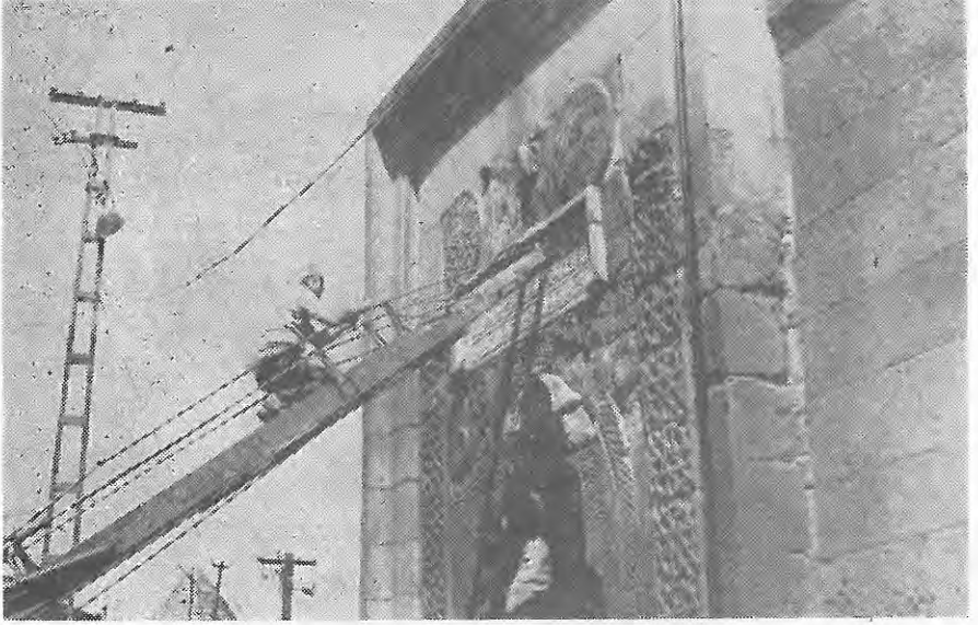
Resim 1 : Burada Şifaiyyenin kapısında, elektrik merdiveni üzerinden yapılan, gözenek resimleri üzerindeki çalışmalar görülmektedir. Resimde görüldüğü gibi, çekilen gözenek resimlerinden, taş üzerindeki Murç izlerini fotoğraf ile tesbit etmek imkanımız olmuştur.